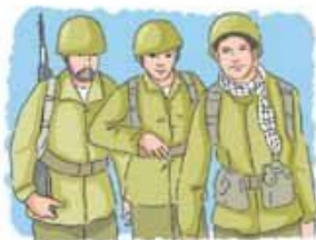
← مُجَاهِدُونَ، مُجَاهِدِينَ